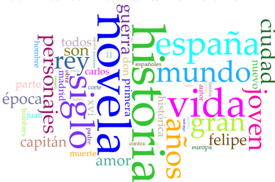
FIG. 3. TÉRMINOS MÁS UTILIZADOS EN LOS RESÚMENES DE LAS NOVELAS ANALIZADAS

Si observamos la nube de palabras resultante del análisis cualitativo del conjunto de resúmenes de las novelas históricas analizadas, los datos nos muestran como términos más significativos, los siguientes: historia, novela, vida, siglo, España, rey, personajes, capitán, ciudad, mundo, joven, guerra, Felipe, amor, Carlos, Madrid, pueblo, familia, padre, XVI, Europa, Isabel, Juan, Fernando o corte . Unos términos que, sin